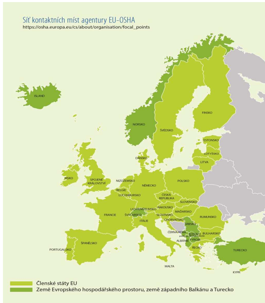
Mapa se vztahuje k roku 2016.